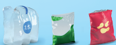
Films, sacs et sachets