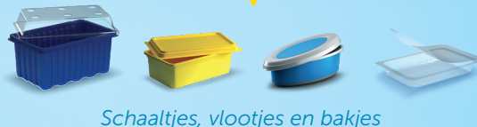
Schaaltjes, vlotjes en bakjes