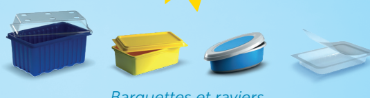
Barquettes et rapiers