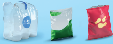
Folies en zakjes