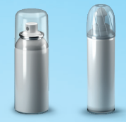
Spuitsbussen voor voedingsmiddelen of cosmetica